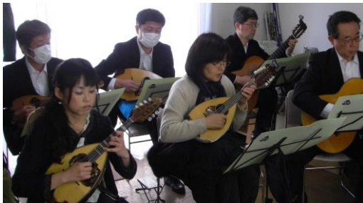
マンドリン・ギター演奏会